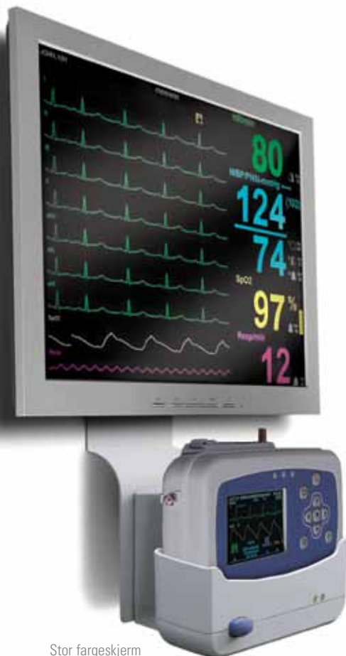
Stor fargeskjerm montert på vegg.

Skriv ut en A4 tabularisk trend rapport som viser pasientdata, uthev alarm hendelser og legg ved pasientjournal, eller skriv ut kurvebilde.